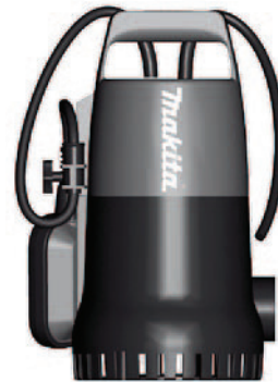
PF 0300 - PF 0800