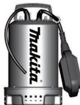
PF 0403 - PF 1100